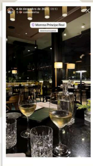
memmo PRÍNCIPE REAL